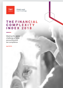
The Financial Complexity Index 2018