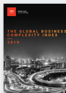
The Global Business Complexity Index 2019