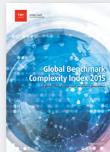
Global Benchmark Complexity Index 2015