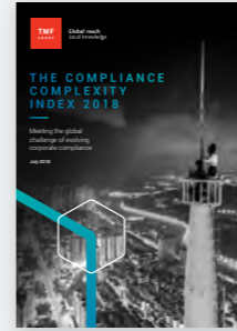
The Compliance Complexity Index 2018