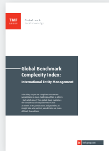
Global Benchmark Complexity Index