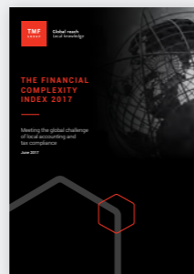
The Financial Complexity Index 2017