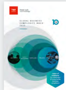
2023年全球商业复杂性指数