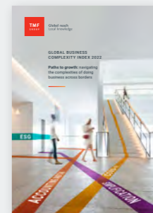
2022年全球商业复杂性指数