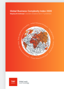
2020年全球商业复杂性指数