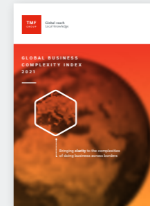
2021年全球商业复杂性指数